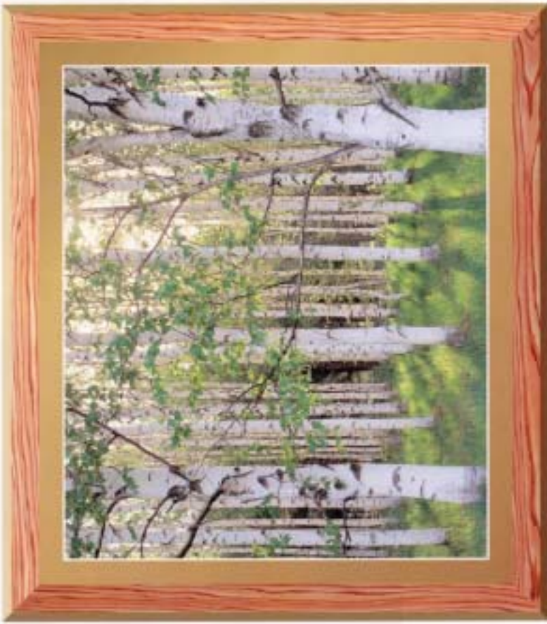
旅のくつろぎと楽しさが集う北の森ガーデン。